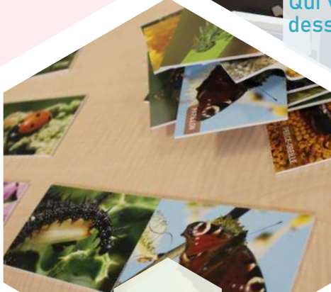
Faites la paire