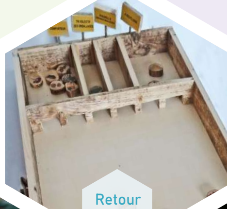
Retour aux vers