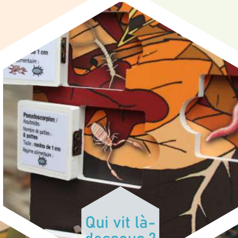
Qui vit là-dessous ?