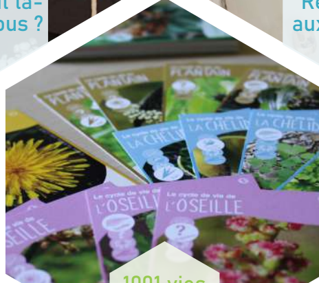
1001 vies des herbes folles