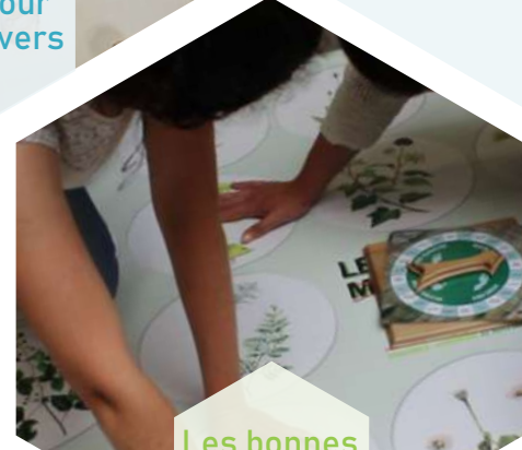
Les bonnes mauvaises herbes