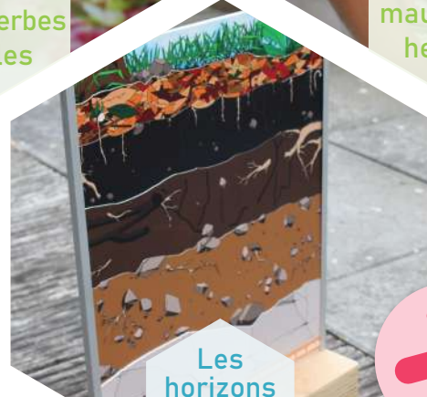
Les horizons sous nos pieds