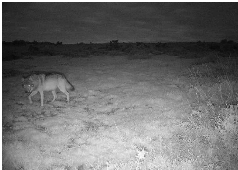
ZEISS NUM1 3C Sa 16.11.2024 07:50:15