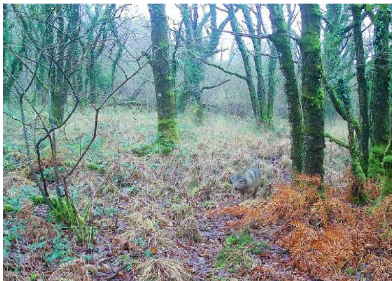
ZEISS NUM5 3C Do 28.11.2024 09:33:46