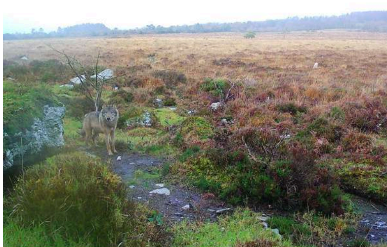
ZEISS NUM2 3C So 22.12.2024 09:58:56